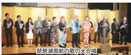
琵琶湖周航の歌の大合唱