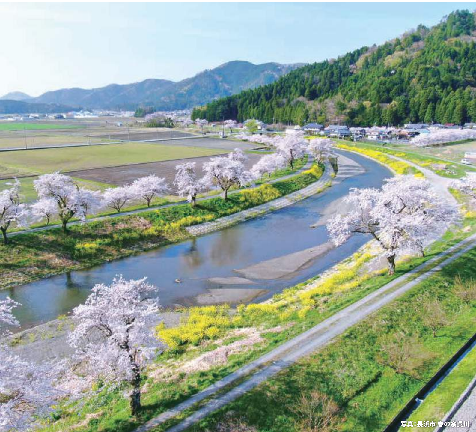
春の余呉川