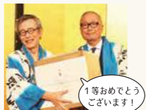
1等おめでとうございます!