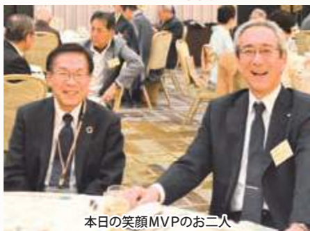
本日の笑顔MVPのお二人