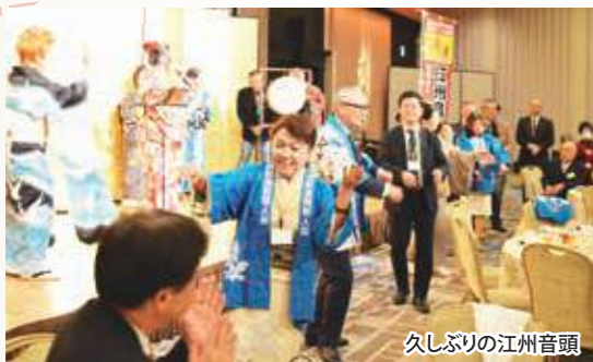
久しぶりの江州音頭