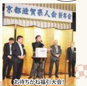
お待ちかね福引大会!