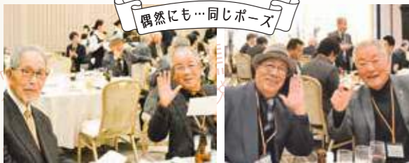
偶然にも...同じポーズ