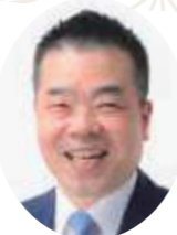
滋賀県知事 三日月 大造