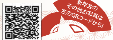
新年会のその他お写真は左のQRコードから!