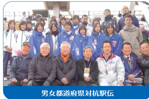
男女都道府県対抗駅伝