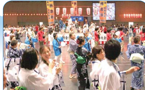
8月 江州音頭フェスティバル