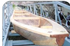
寄贈した三十石船