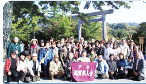
日帰りバスツアー